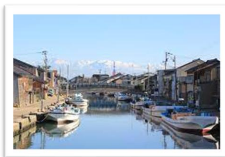
富山県射水市内川沿いの風景

私は富山県射水市で育ちました。家の後ろには内川という川があり、何艘も漁船が停まっています。小さい頃は漁船に飛び乗って遊び (今は絶対できません…)、たも網を持って毎日飽きもせず、ウグイやハゼ、カニを捕まえていました。ふるさとの思い出はいつも体験と共にあり、懐かしく、時折ふるさとの地へと呼び戻してくれます。先日、中学年の校外学習に行きました。丸山酒造さんのお計らいで、子どもたちに清酒に使うお水を飲ませていただき、「うまい!」「今まで飲んだお水の何千倍もおいしい!」と目を輝かせて喜ぶ子どもたちの姿がありました。ふるさと美守の自慢として心に刻まれ、この感動は一生忘れられないものとなったでしょう。ふるさとでの楽しい体験はふるさとを愛おしむ心につながります。美守小の子どもたちには、地域での楽しい体験を通して、ふるさとの魅力を心に刻み、ふるさとへの愛と誇りをもつ人となって大成してほしいです。(校長)