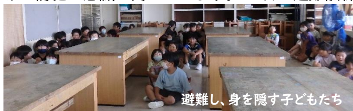
避難し、身を隠す子どもたち

7月は、子どもたちの夏休みムードが高まる一方、子どもをターゲットとした犯罪が増加する季節でもあるそうです。美守小学校では、夏休み前に登校班集会を開き、地域の危険箇所を子どもたちと一緒に確認したり、不審者対応の避難訓練を実施し、スクールサポーターさんや上越警察署の方から防犯に関わる指導をいただいたりしながら、夏休みに向けて防犯の意識を高めています。13日の避難訓練は、校内に不審人物が侵入、子ども