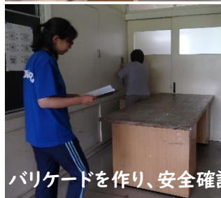
バリケードを作り、安全確認