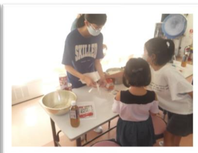
炊き出しを分け合って食べる