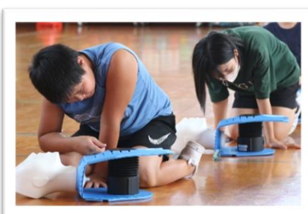
心肺蘇生法講習会