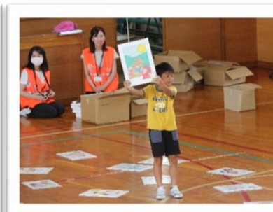
防災かるたで振り返り