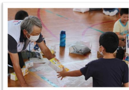
牛乳パックで食器づくり

美守小学校が長い間続けてきた「白山防災の日」。長年育ててきた「自らの命を守り抜くための主体的な意識と行動力」を、子どもたちには、地域の人たちや自分のよりよい人生のために活かしてほしいと思います。また、ご協力いただきました三和区総合事務所、赤十字奉仕団三和分団、県災害救済赤十字奉仕団、社会福祉協議会、上越南消防署高士分遣所他、多くの皆様にご心より感謝申し上げます。